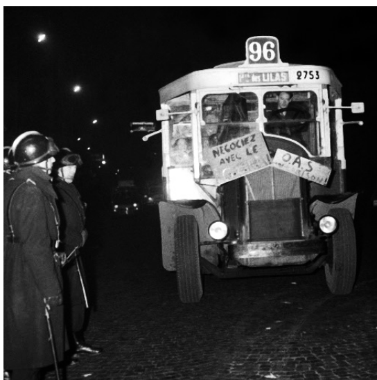
Manifestation anti-OAS: Bus 96, 19 décembre 1961.

journées d'études • mardi 11 & mercredi 12 février 2014 Campus de l'université Paris Ouest Nanterre • salle de réunion de la Bibliothèque de Documentation Internationale Contemporaine